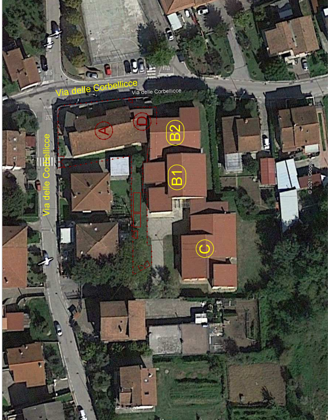
FOTOGRAFIA AEREA DEL CANTIERE