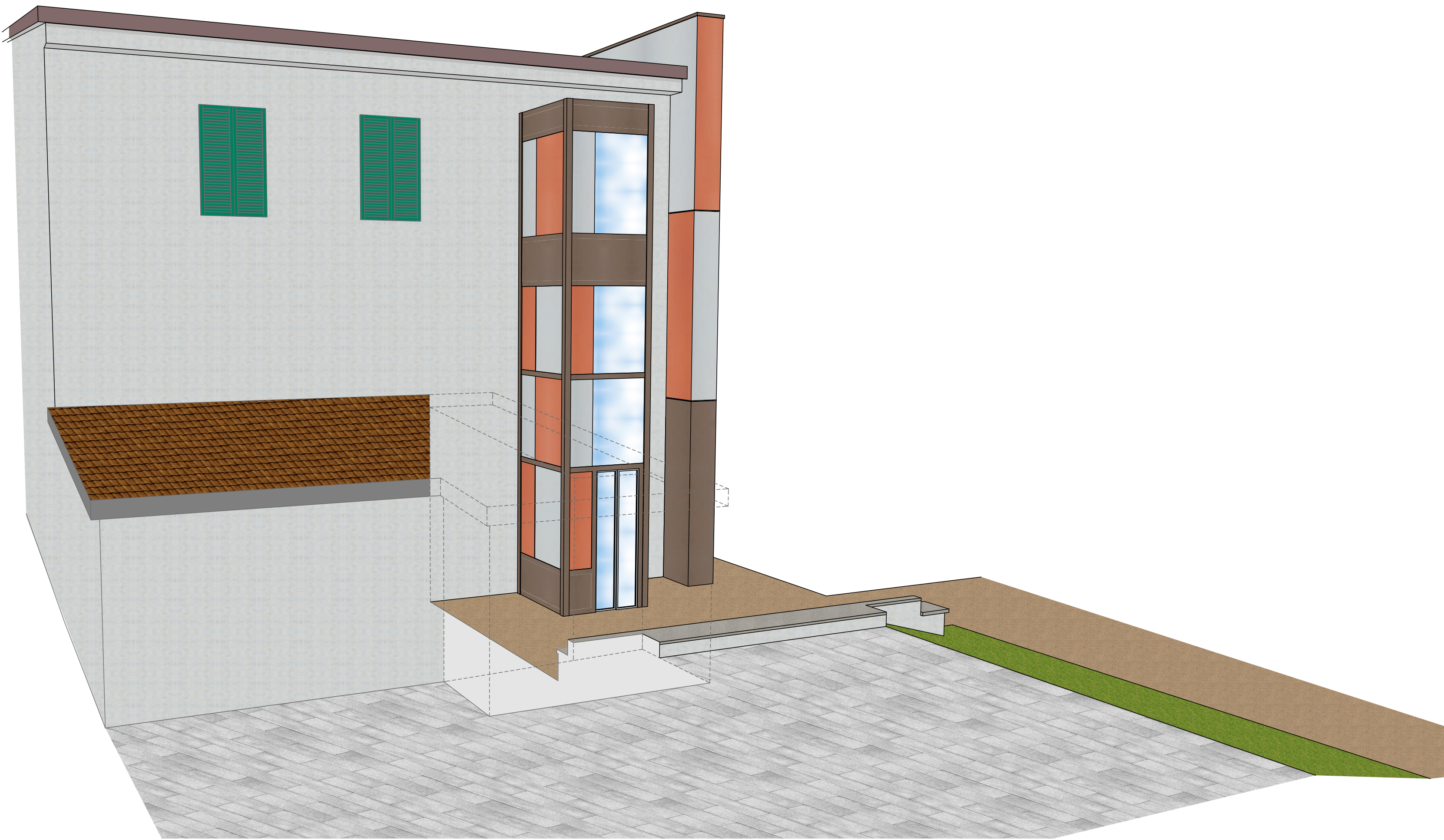
VEDUTA DA PIAZZA AGENORE FABBRI